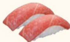
◎◎10- Ventresca de atún Fatty tuna 6,50