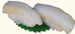
◎◎5- Pez mantequilla Butterfish 3,75