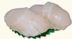
◎◎11- vieira 5,95 Scallop