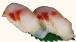
◎◎9- Dorada 3,50 Golden fish