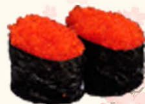
◎◎18 - Tobico 5,85 Huevas de pez valador Egg flying fish roe