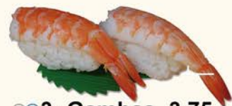
◎◎3- Gambas 3,75 Shrimp