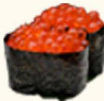
◎◎17- Ikura 6,25 Huevas de salmón Egg salmon