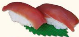
◎◎2- Atún 4,50 Tuna