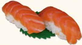
◎◎1- Salmón 3,65 Salmon