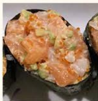
◎◎◎16- Kai 5,95 Salmón,vieira,tobiko, aguacate y mayonssa Salmon,sacallop,tobiko, avocado y mayonnaise